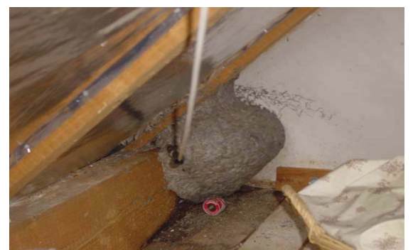
Diese Wespen bahnten sich einen Weg in das darunter liegende Wohnzimmer