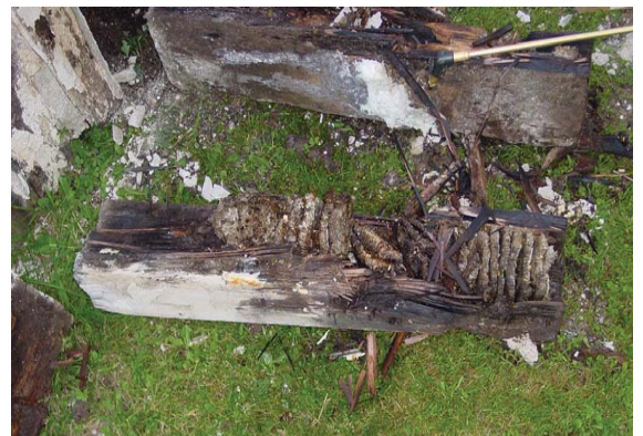
Hier hölten sie eine Bahnschwelle komplett aus