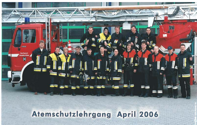
Atemschutzlehrgang April 2006

Unsere sieben neuen Atemschützer haben die hohen Anforderungen an Gesundheit und Fitness bestanden.