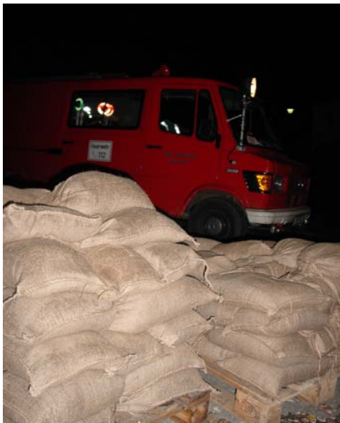
Hochwasser im Landkreis Kelheim Foto's vom 22. und 23. August 2005 in Weltenburg