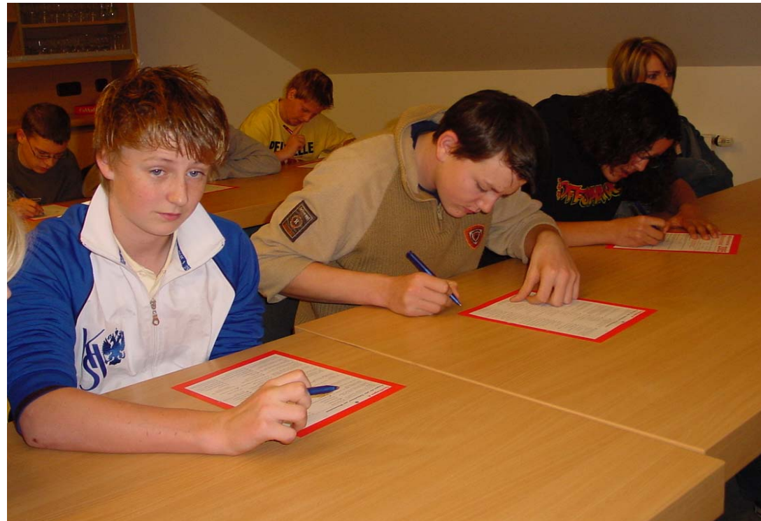
Foto: Unsere Jugend beim Wissenstest