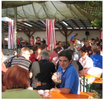
gemütlich oder ?