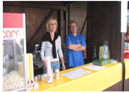
einfach super, diese Unterstützung