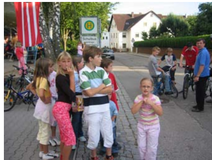
wer will mit dem FF-Auto fahren