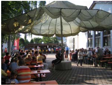
war wieder ein Erfolg.